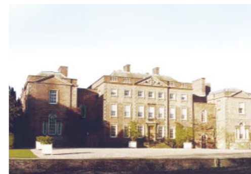
Verwaltung Ross-on-Wye Bei Ross-on-Wye, südlich von Birmingham, steht die Verwaltung für Großbritannien.

Wir wollen auch nach Ihrem Praktikum nicht den Kontakt zu Ihnen verlieren. Daher haben wir einen Praktikantenpool eingerichtet. Zeigen Sie während Ihres Praktikums auffallend gute Leistungen, möchten wir natürlich auch über den Praktikumszeitraum hinaus mit Ihnen in Verbindung bleiben. Von Zeit zu Zeit organisieren wir daher für ehemaligen Praktikanten einen Workshop, Exkursionen, öffentliche Ausstellungen oder ähnliche Veranstaltungen. Außerdem bekommen Sie alle 3 Monate per Post unsere Firmenzeitung mit aktuellen News.