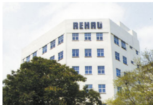
Verwaltung Singapur Weltmetropole eines aufstrebenden Wachstumsmarktes: Singapur ist Sitz der Verwaltung für REHAU in Asien und Australien.