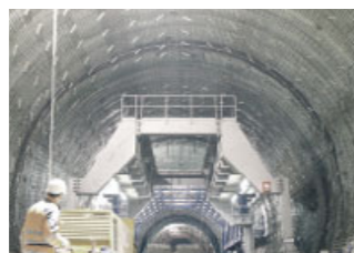
Weltweit sorgen ausgeklügelte Rohrsysteme von REHAU für eine sichere und effektive Tunnelentwässerung.