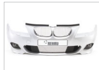
Namhafte Automobilhersteller setzen auf REHAU Stoßfängersysteme, die für optimalen Fahrkomfort und Sicherheit sorgen.