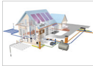
REHAU bietet vom Dach bis zum Erdreich ein umfassendes Komplettprogramm für energieeffizientes Bauen.

Hier eine Auswahl an innovativen Systemlösungen aus unseren Bereichen Bau, Automotive und Industrie: