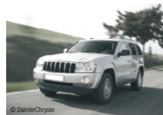
Ob Stoßfängersysteme, wie für den Grand Cherokee, Kotflügel, Einstiegsleisten oder Schwellerverkleidungen – REHAU setzt Maßstäbe.