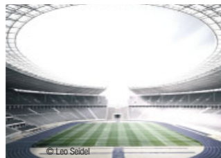
Europas größte und bekannteste Arenen und Fußballstadien sind mit REHAU Systemen für Rasenheizungen ausgestattet.