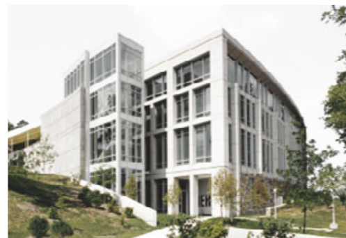
Verwaltung Leesburg Nahe Washington DC liegt die Verwaltung Leesburg. Von hier aus werden der nordamerikanische Markt sowie Mexiko betreut.