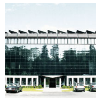
Verwaltungszentrale Muri Die Verwaltungszentrale der Unternehmensgruppe hat ihren Sitz seit mehr als 40 Jahren im schweizerischen Muri nahe Bern.