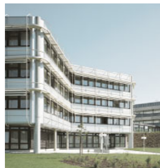
Verwaltung Reutlingen Der Stammsitz unseres Unternehmens befindet sich seit 1948 in Reutlingen, Oberfranken. Hier sind mehr als 2.100 Mitarbeiter beschäftigt.