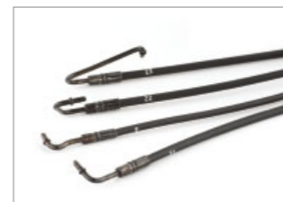
REHAU Hydraulikschläuche sorgen dafür, dass sich Cabriovertende auf Knopfdruck elektrohydraulisch öffnen und schließen lassen.