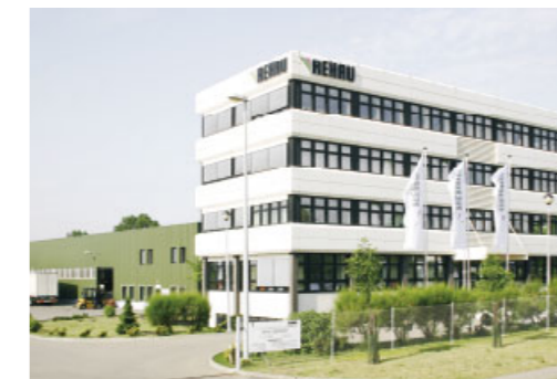
Verwaltung und Verkaufsbüro Posen Das im typischen REHAU Stil erbaute Gebäude ist Sitz der Verwaltung und des Verkaufsbüros Posen in Polen. Darüber hinaus ist REHAU mit mehr als 15 Standorten im Wachstumsmarkt Osteuropa stark vertreten.