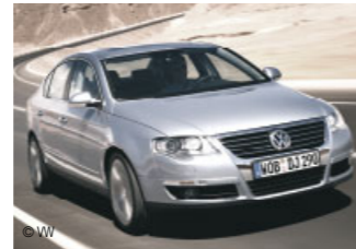
Für die Entwicklungsleistungen des Stoßfängersystems am Passat ist REHAU mit dem „VW Group Award“ ausgezeichnet worden.