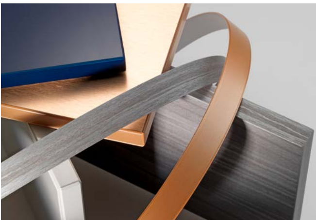
Edelmatt-, Spiegelglanz-, Metall-Optik-, 3D-Optik-, Glas-Optik- und lichtdurchlässige Kanten