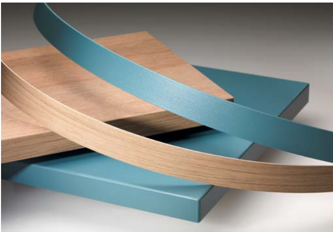
Uni- und Dekorkanten