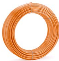
Tubo RAUTHERM SPEED

Conectores SPEED para los tubos REHAU RAUTHERM SPEED 16, RAUTHERM SPEED K 16 o RAUTHERM S 17.