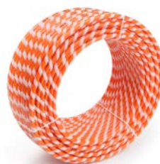
Tubo RAUTHERM SPEED K