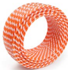
RAUTHERM SPEED K