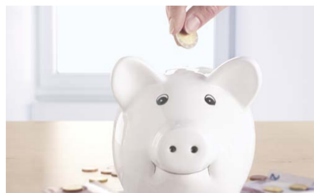
Flexibel und wirtschaftlich

Dadurch werden Scherlasten und Abwinklungen die durch das unterschiedliche Setzungsverhalten der Haupt- und Anschlussleitungen entstehen, besonders gut absorbiert.