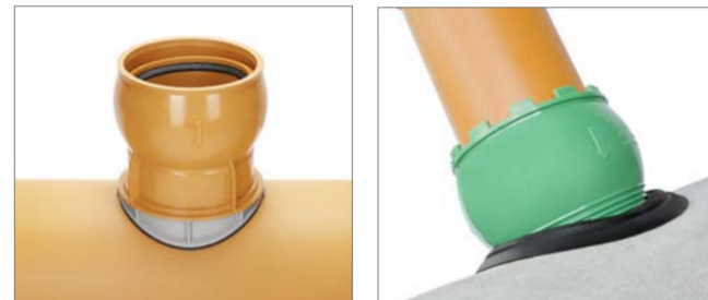
NEU: AWADOCK POLYMER CONNECT Anschluss an glattwandige Kunststoffrohre aus PP, PE, PVC und GFK AWADOCK NEW GENERATION Anschlussysteme an Beton-, Stahlbeton- und Steinzeugrohre

Das Kanalrohr-Anschlussystem AWADOCK bietet mit seiner Variantenvielfalt eine optimale und dauerhaft dichte Lösung zur nachträglichen seitlichen Anbindung von Hausanschluss- und Nebenrohrleitungen.