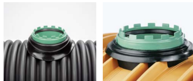
AWADOCK CP Anschluss an Kanalverbundrohre AWADOCK für den Anschluss an den REHAU Kanalschacht aus PP