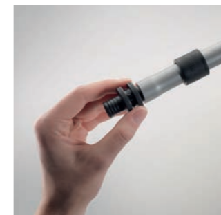
2 Вставляють фітинг