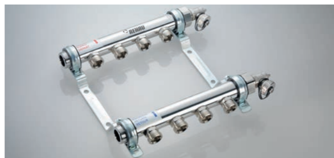
Колектор трубопроводу опалення виготовлений з високоякісної сталі; особливо компактний завдяки скороченим відстаням між виходами.

З нашим асортиментом труб, фітінгів та обладнання можна реалізувати всі варіанти монтажу. До асортименту продукції, що випускається, входить колектор для системи опалення, призначений для розподілу та поєднання з'єднувальних трубопроводів.