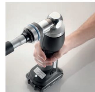
1 Розширюють кінець труби

Надійність без компромісів: RAUTITAN разом з трубою, фітингом та насувною гільзою утворює довготривале герметичне з'єднання. Та без ущільнювального кільця. Сама труба зберігає герметичність. Допускається одразу піддавати її навантаженню тиском. Надійні матеріали можна обробляти при температурах до -10 °C.