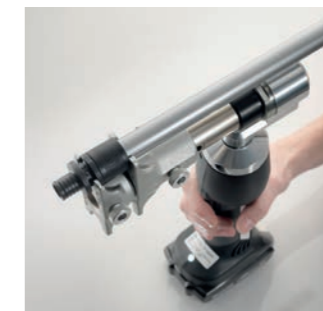
3 Надягають насувну гільзу