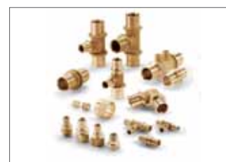
Raccords à sertir SDR11 LX

Large gamme de raccords à sertir en laiton