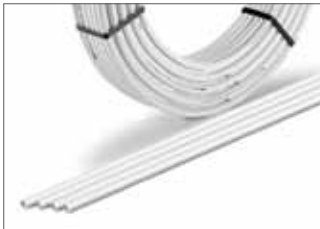
Tube RAUTHERM Multi (multicouche)