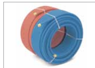
Tubes pré-gainés RAUTHERM (PE-Xa) et RAUTHERM Multi (multicouche)