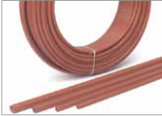
Tube RAUTHERM (PE-Xa) avec barrière anti-oxygène