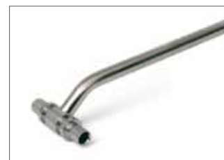
Canne de piquage

Large gamme de raccords à sertir en laiton