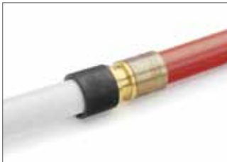
Un système unique de raccordement