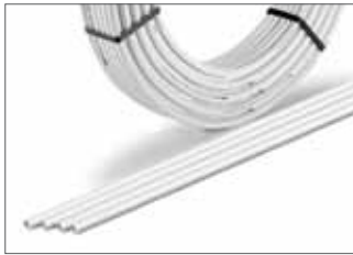
Tube RAUTHERM Multi (multicouche)