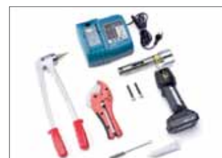
Outillage à sertir