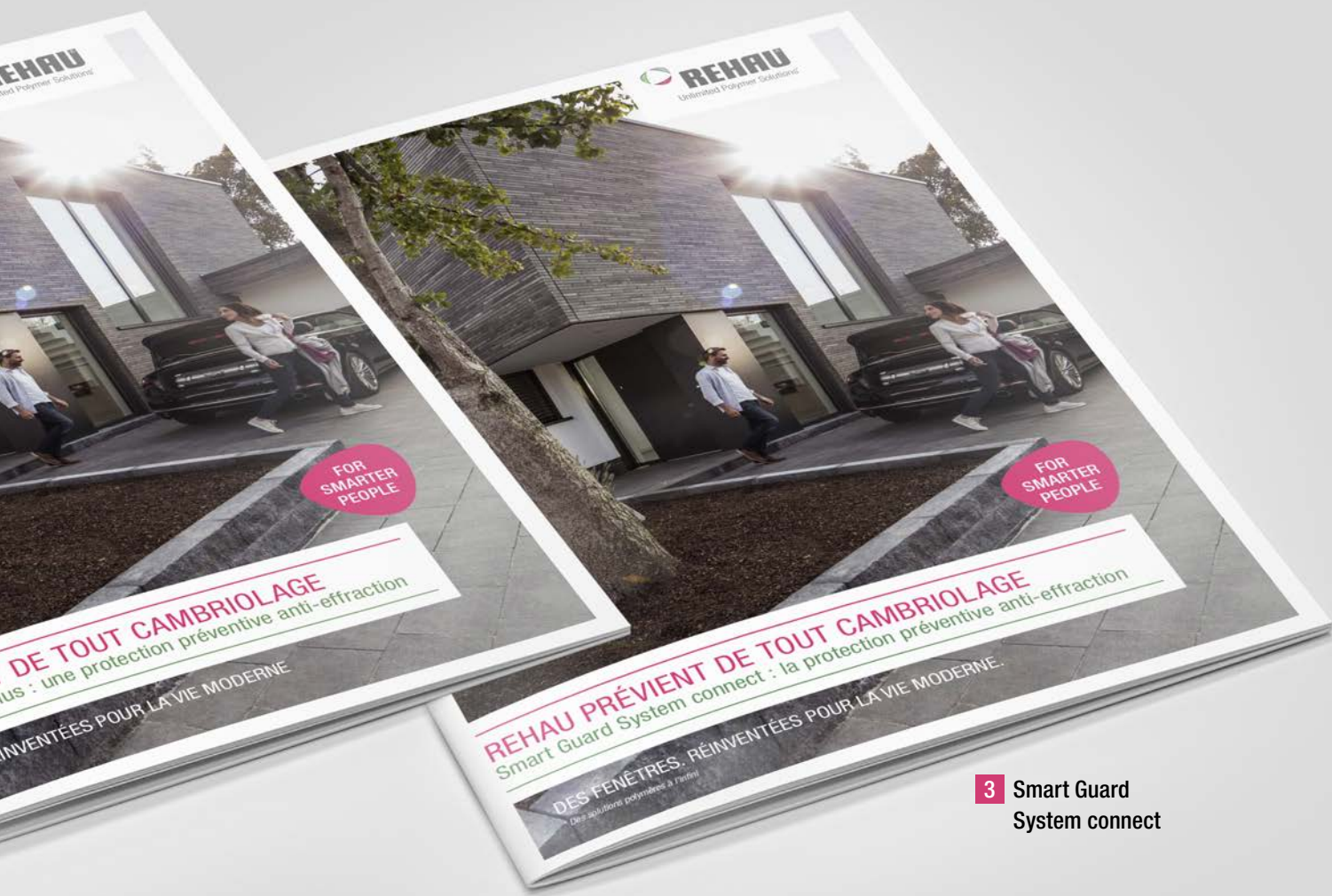
2 Smart Guard System plus