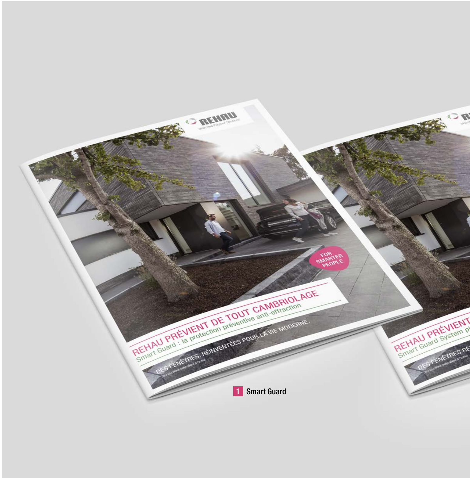
1 Smart Guard