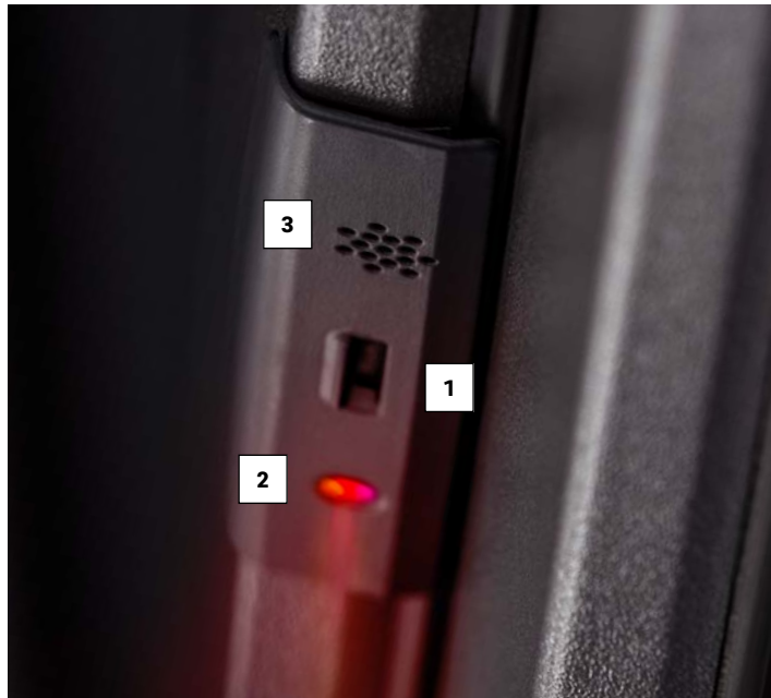
1 Detektor premikanja 2 LED-lučka 3 Zvočna naprava

Da se doma počutite varne, ne potrebujete ne visokih zidov ne vidno nameščenih alarmnih naprav. Zaščita Smart Guard je vgrajena v okenski okvir, kjer dejavno skrbi za preventivno zaščito. Pametni senzor zazna vlomilce in samodejno zažene obrambni program.