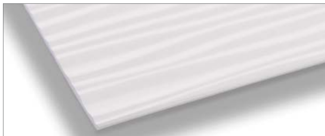
Laminado de tan sólo 2,0 mm de grosor