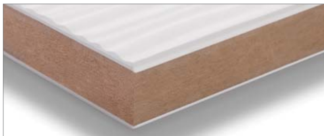
Panel prensado con MDF (gran formato)