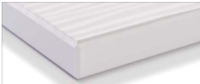
Componente provisto de canto aplacado con láser (a medida)

Todos los componentes están diseñados para dotar al conjunto de una elevada solidez, gracias a su construcción simétrica.