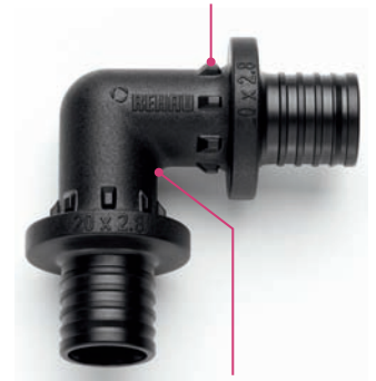
Ligero pero resistente a la rotura: RAUTITAN PX soporta sin problemas grandes cargas.

Para una elaboración segura: leva de centrado para la correcta colocación de la herramienta de montaje RAUTOOL.