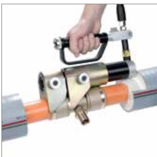
La tecnica di collegamento con manicotto autobloccante sviluppata e brevettata da REHAU garantisce tenuta e durata nel tempo.