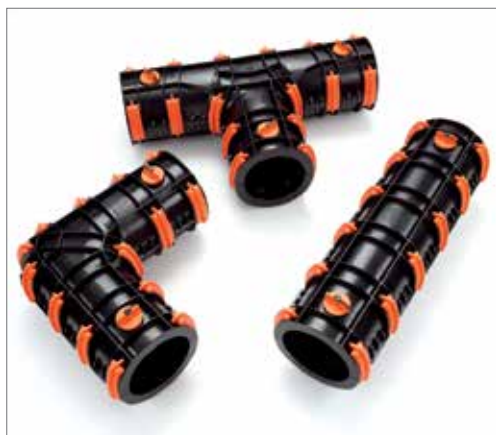
Set di manicotti RAUTHERMEX a T, L e I generazione II