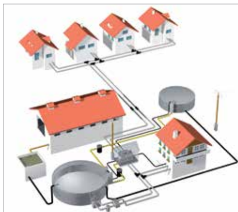
Tubi per impianti a biogas

Il sistema di tubi RAUTHERMEX, grazie alle sue caratteristiche, viene utilizzato per sfruttare il calore di scarico prodotto dagli impianti a biogas.