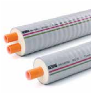
Lo strato di sbarramento di colore arancione soddisfa i requisiti della normativa DIN 4726.

Nell'edilizia moderna, sia residenziale che industriale, l'approvvigionamento energetico avviene sempre più spesso tramite teleriscaldamento. Per poter sfruttare i vantaggi ecologici ed economici di questi nuovi sistemi di riscaldamento, occorre un impianto di condutture in grado di ridurre ai minimi livelli non solo le spese di gestione, ma anche quelle di installazione e di manutenzione. La soluzione: RAUTHERMEX di REHAU.