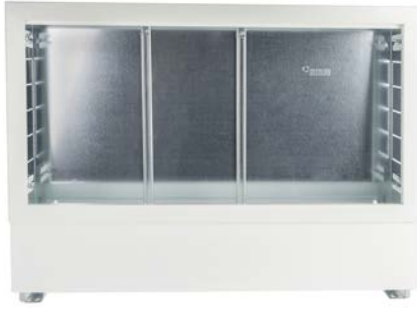
Abb. 1-1 Verteilerschrank UP 75 kompakt, Schranktiefe 75 mm

Der Verteilerschrank UP 75 kompakt ist für die Unterputzmontage ausgelegt. Durch seine geringe Bautiefe von nur 75 mm ist er besonders für Trockenbauwände geeignet, sowie höhen- und tiefenverstellbar. Die Seitenwände sind mit Vorprägungen für primärseitige Vor- und Rücklaufleitungen, wahlweise rechts- oder linksseitig versehen. Die C-Schienen zur Aufnahme der