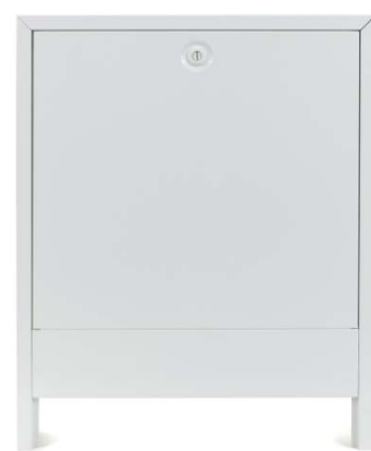
Armoire entièrement assemblée