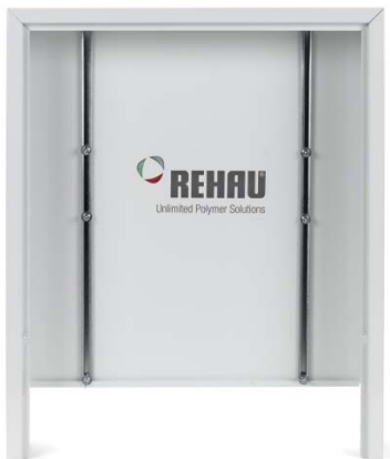
Plaque de finition et porte enlevées

*Plaque de finition amovible sous la porte qui permet d'agrandir l'ouverture de l'armoire au plancher (27 po / 69 cm).