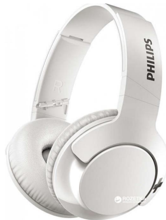
Навушники Philips SHB3175WT / 00 White Орієнтовна вартість 1600 бонусів