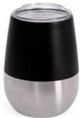
Термокружка 300 мл Орієнтовна вартість 250 бонусів