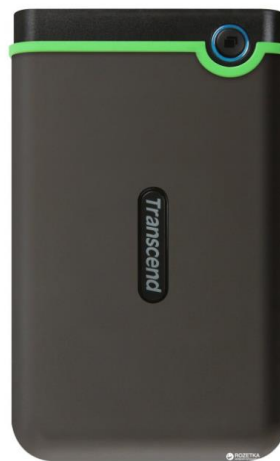
Жорсткий диск Transcend StoreJet 25M3S 500GB Орієнтовна вартість 1800 бонусів