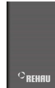
Батарея універсальна PowerBank Орієнтовна вартість 360 бонусів