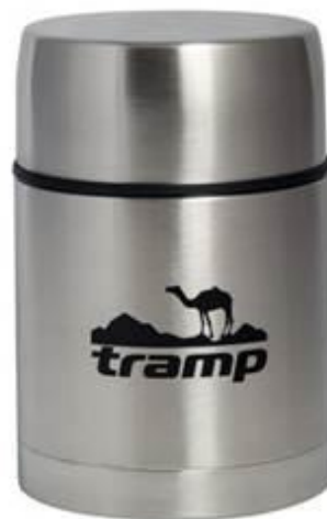
Термос для їжі TRAMP 700 мл. Орієнтовна вартість 900 бонусів