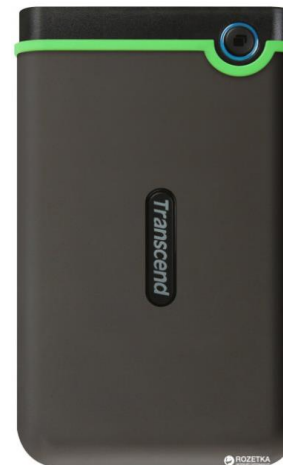
Жорсткий диск Transcend StoreJet 25M3S 1TB Орієнтовна вартість 2000 бонусів