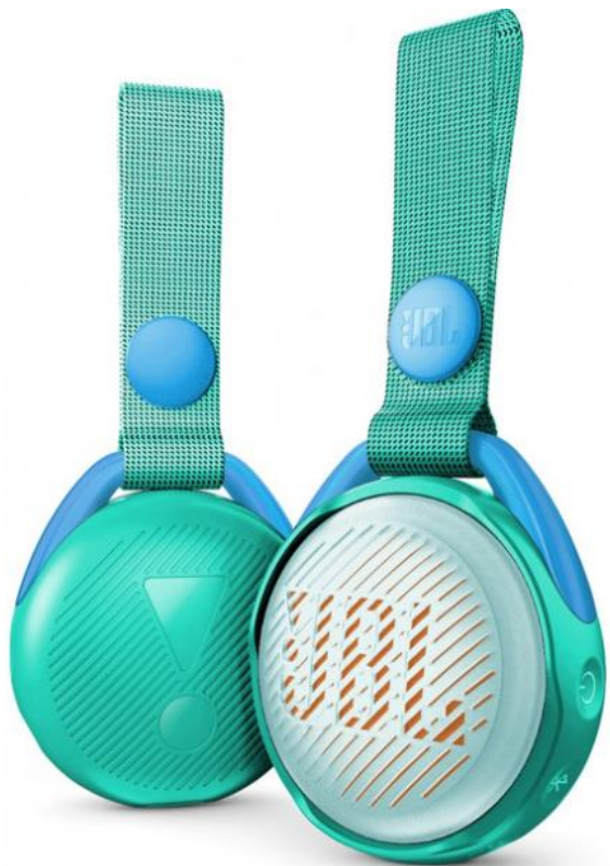
Акустична система JBL JR POP Teal Орієнтовна вартість 1150 бонусів