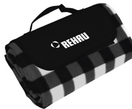
Туристичний килимок 120X138 Орієнтовна вартість 300 бонусів