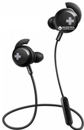
Навушники Philips SHB4305BK / 00 Black Орієнтовна вартість 1300 бонусів