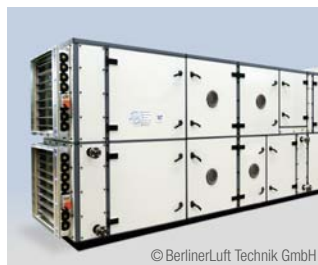
Klima- und Lüftungstechnik