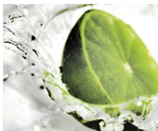
Trinkwasser- und Getränketechnik