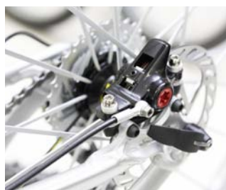
Sport und Freizeit