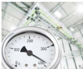
Anlagen-, Geräte- und Maschinenbau