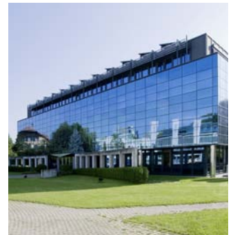
Verwaltungszentrale Muri Die Verwaltungszentrale der Unternehmensgruppe hat ihren Sitz seit mehr als 40 Jahren im schweizerischen Muri nahe Bern.