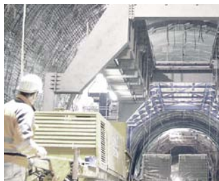
Weltweit sorgen ausgeklügelte Rohrsysteme von REHAU für eine sichere und effektive Tunnelentwässerung.