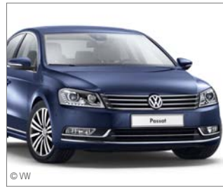
Für die Entwicklungsleistungen des Stoßfängersystems am Passat ist REHAU mit dem „VW Group Award“ ausgezeichnet worden.