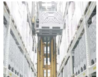
REHAU entwickelt maßgeschneiderte Produktlösungen für unterschiedliche Branchen, beispielsweise intelligente Lager- und Verpackungssysteme.