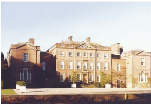
Verwaltung Ross-on-Wye Bei Ross-on-Wye, südlich von Birmingham, steht die Verwaltung für Großbritannien, Skandinavien und Südafrika