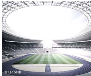
Europas größte und bekannteste Arenen und Fußballstadien sind mit REHAU Systemen für Rasenheizungen ausgestattet.