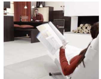
REHAU bietet viele Möglichkeiten für individuelle Möbelgestaltung: mit Kantenbändern, Wandanschlussprofilen und Schrankrollladensystemen aus einer Hand.