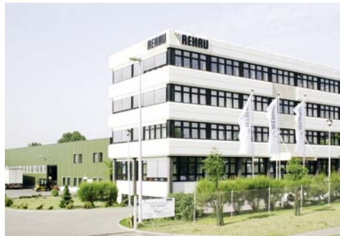
Verwaltung und Verkaufsbüro Posen Das im typischen REHAU Stil erbaute Gebäude ist Sitz der Verwaltung und des Verkaufsbüros Posen in Polen. Darüber hinaus ist REHAU mit mehr als 15 Standorten im Wachstumsmarkt Osteuropa stark vertreten.