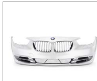
Namhafte Automobilhersteller setzen auf REHAU Stoßfängersysteme, die für optimalen Fahrkomfort und Sicherheit sorgen.