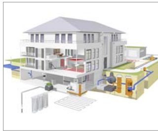
REHAU bietet vom Dach bis zum Erdreich ein umfassendes Komplettprogramm für energieeffizientes Bauen.

Als Premiummarke für polymerbasierte Lösungen in den Bereichen Bau, Automotive und Industrie ist REHAU international führend. Vom Hydraulikschlauch in Miniaturabmessungen über intelligente Stoßfängersysteme bis hin zu komplexen Lösungen für energieeffizientes Bauen – unsere innovativen Produktentwicklungen begegnen Ihnen täglich, meist ganz selbstverständlich und ohne dass Sie es merken, aber immer mit spürbarem Nutzen.