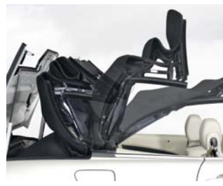
REHAU Hydraulikschläuche sorgen dafür, dass sich Cabrioverdecke auf Knopfdruck elektrohydraulisch öffnen und schließen lassen.