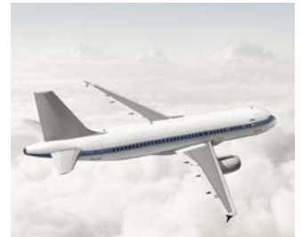
REHAU liefert Faserverbundwerkstoffe für die Luftfahrtindustrie