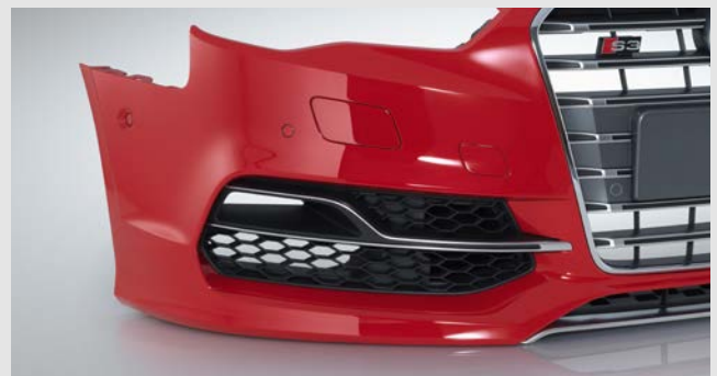
REHAU lackiert für die Automobilindustrie Stoßfänger in 500.000 Farb- und Ausstattungsvarianten.