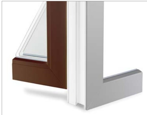
Lackierung außen und innen verschieden