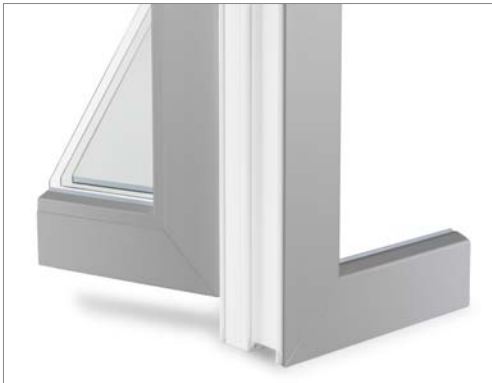
Lackierung außen und innen gleich