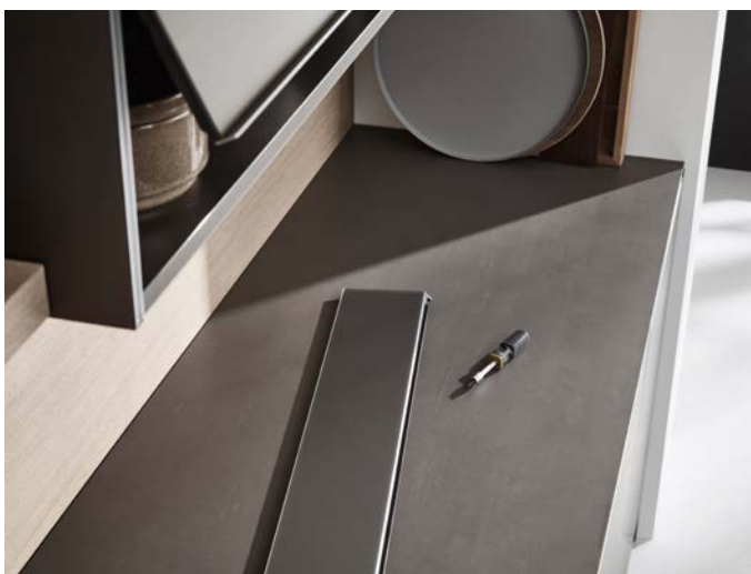
Możliwość wymiany pojedynczych profili.