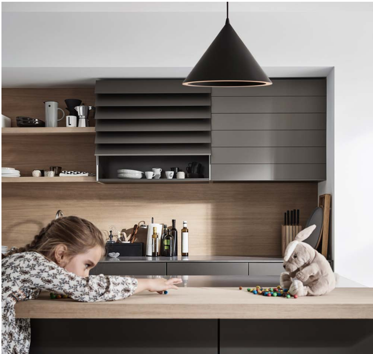
Wyjątkowy wygląd dzięki fazowanym profilom.