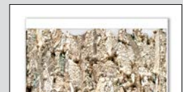
Couche fonctionnelle avec joint à peine perceptible