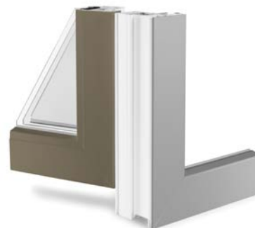
Sees ja väljas erinev lakk