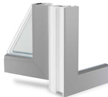
Sees ja väljas sama lakk