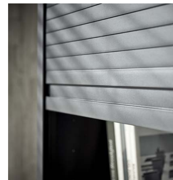
RAUVOLET noble matt