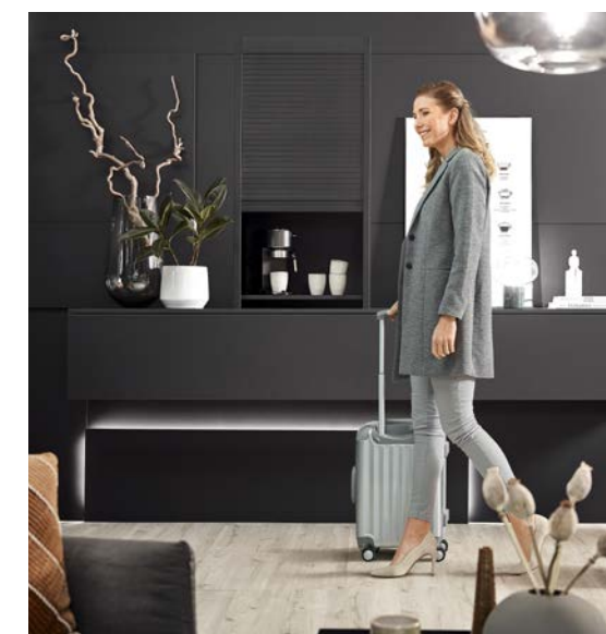
Linia wzornicza noble matt

Przestrzeń do przechowywania bez kompromisów w kwestii funkcjonalności - to cel naszej kolekcji "Sztuka przechowywania". Nie ma znaczenia, czy wybierzesz szlachetny mat, optykę szkła czy metalu, żaluzje czy szafkę żaluzjową FLIPDOOR - sam zdecydujesz, które rozwiązanie jest odpowiednie. Ofertę dopełniają powierzchnie RAUVISIO oraz obrzeża RAUKANTEX tworzące spójną linię wzorniczą.