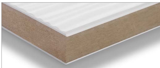
Prasowana płyta MDF (wielkoformatowa)