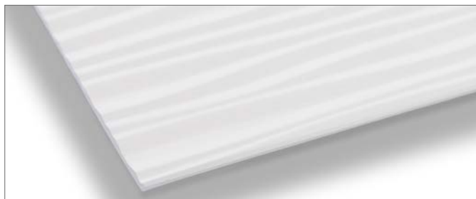
Laminat o grubości 2 mm